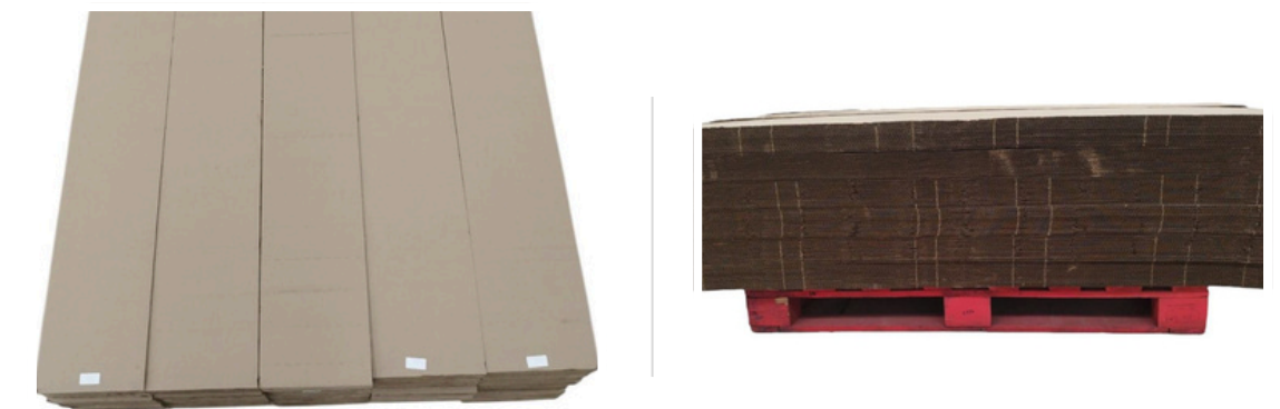
Almacenamiento de paneles que no están en uso