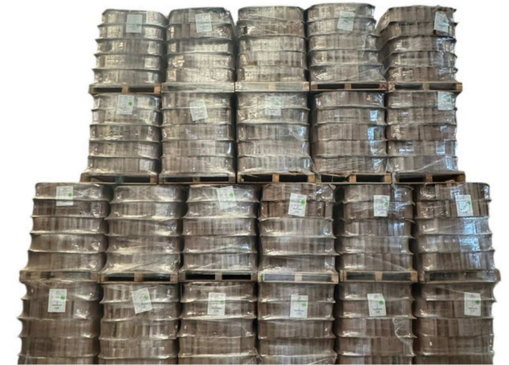
Almacenamiento con producto en proceso intermedio